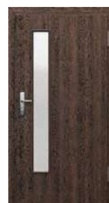
model 3 (EI 30, EI 30 soft)