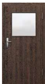
príklady zasklenia KONTRAKT (EI 30)