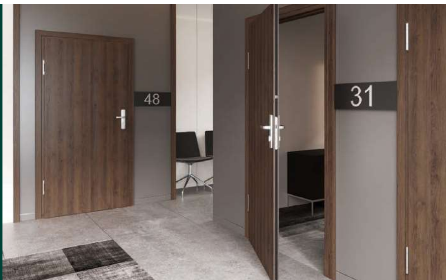
Protipožiarne EI 30

EI 30 Požiarna odolnosť 30 min. Akustická izolácia R_w=32 dB*