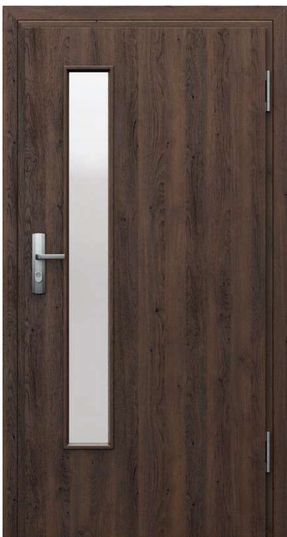
Model 3, Dub Hnedý, zárubňa MDF