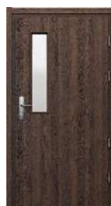
model 2 (EI 60)