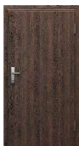
plné (EI 30)